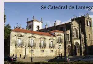
Sé Catedral de Lamego