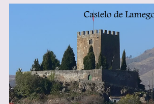
Castelo de Lamego