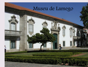
Museu de Lamego