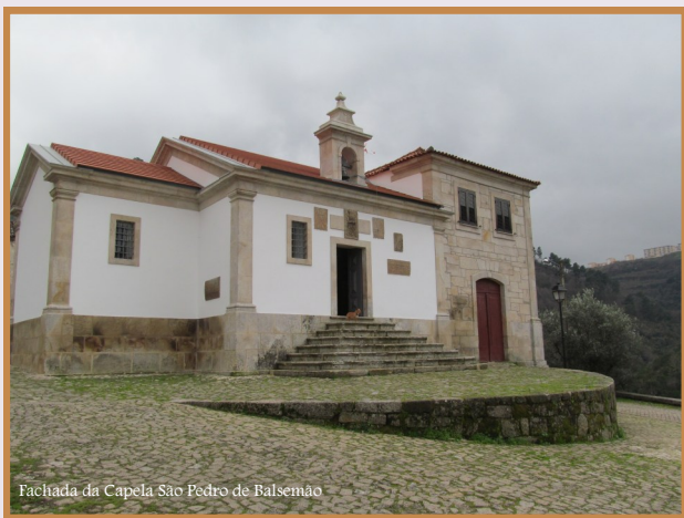
Fachada da Capela São Pedro de Balsemão

A sua origem remota aos tempos da reconquista crista da região,, no século X, época em que a cidade, sob a tutela do seu castelo, se transformou num polo estratégico e administrativo importante.