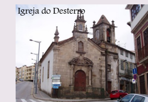
Igreja do Desterro