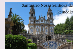
Santuário Nossa Senhora dos Remédios

Lamego é uma cidade portuguesa no Distrito de Viseu, Região Norte e sub-região do Douro, sendo a segunda maior cidade do distrito. O município está situado na margem sul do rio Douro. Lamego é uma cidade histórica e as suas origens permanecem por desvendar. Esta cidade antiquíssima foi reconquistada definitivamente em 1057 por Fernando Magno de Leão aos mouros.