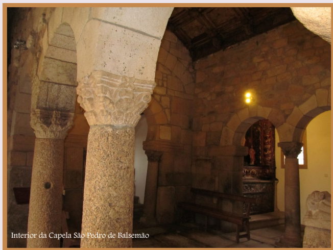
Interior da Capela São Pedro de Balsemão

No terceiro quartel do século XIV, o Bispo do Porto, D. Afonso Pires, escolheu o local para a sua sepultura e ergueu uma “capela” ou altar em honra de Santa Maria, cuja construção e consagração, em 1362, se encontra assinalada por uma epigrafe de pedra de ança, em caracteres góticos, colocada junto do arco triunfal.