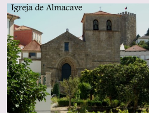
Igreja de Almacave